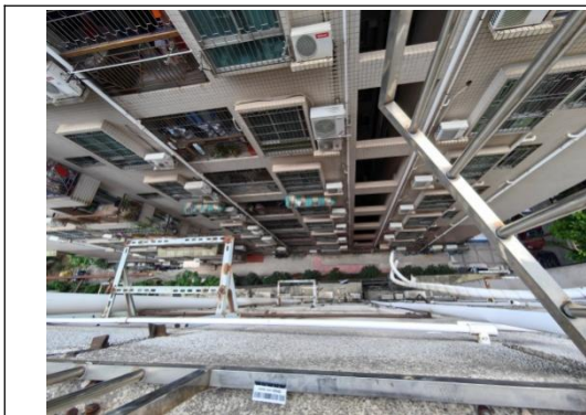
图 3 事发窗台位置示意图

3.窗外空调安装的墙体为红砖砌成，外墙水泥砂浆石米批荡，左侧有一个空调主机支架，右侧另一个空调支架位置(事故发生)墙体上留有左右两排各三个螺丝孔，左侧螺丝孔有向下磨擦的痕迹；垂直向下发现 6 楼窗外右边的空调支架发生向下变形，防盗窗右侧有一条约两米半长的空调铜管组件。(见图 3-6)