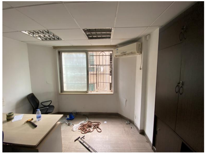
图 2 事发办公室示意图

3.窗外空调安装的墙体为红砖砌成，外墙水泥砂浆石米批荡，左侧有一个空调主机支架，右侧另一个空调支架位置(事故发生)墙体上留有左右两排各三个螺丝孔，左侧螺丝孔有向下磨擦的痕迹；垂直向下发现 6 楼窗外右边的空调支架发生向下变形，防盗窗右侧有一条约两米半长的空调铜管组件。(见图 3-6)