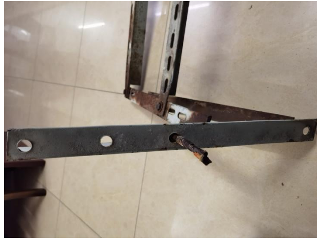
图 11 空调支架及锈蚀的爆炸螺栓示意图