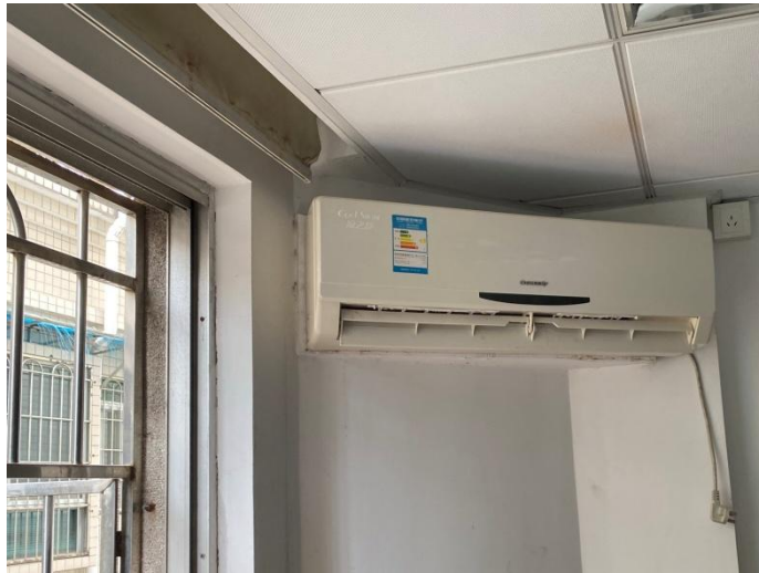
图 7 室内机未拆除

5.查阅监控视频，11:01:04 钟某某连人带空调支架坠落，先摔到 1 楼的雨棚靠围墙位置后，再坠落至巷道地面。