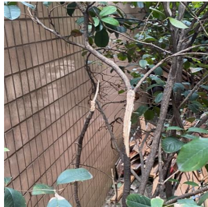
图 9 压折的小树示意图

7. 查阅警方拍摄的照片，坠落后的钟某某身穿蓝色短袖T恤、蓝色长裤头朝下侧身卧躺在地面上，脸部下方地面有一滩血迹，身上系着安全带，安全带的另一端扣挂在一起坠落下来的支架上。（见图 10）