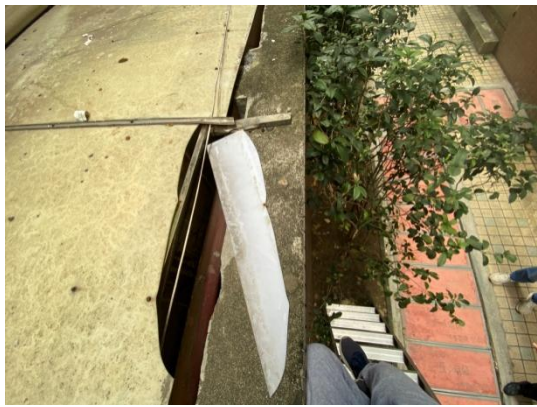
图 8 雨棚顶板碎块示意图