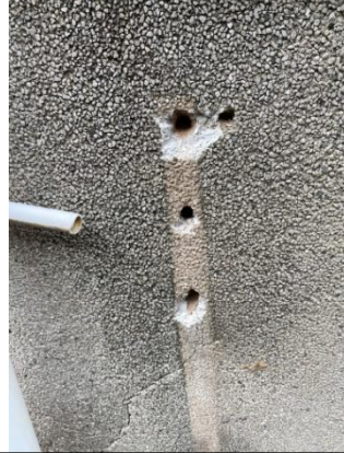
图 6 空调支架螺栓孔示意图