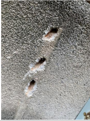
图 5 空调支架螺栓孔示意图