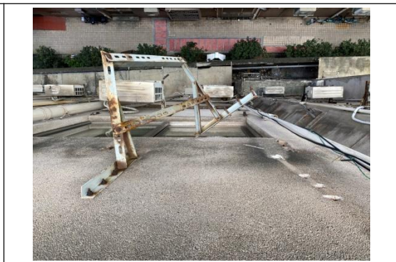
图 4 可见 6 楼空调支架变形示意图