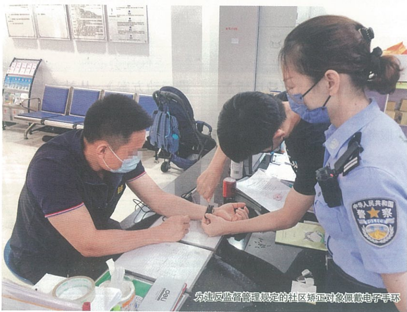
为违反监督管理规定的社区矫正对象佩戴电子手环

规定落实落细；越秀区公安分局进一步规范了暂予监外执行对象由取保候审、监视居住移送社区矫正工作，加大了收监执行和上网追逃力度，及时通报社区矫正对象被行政拘留、采取强制措施等情况；越秀区人民检察院以上级巡回检察为契机，加强了社区矫正全流程监督，促进各部门依法协作，不断提高工作质效。2021年12