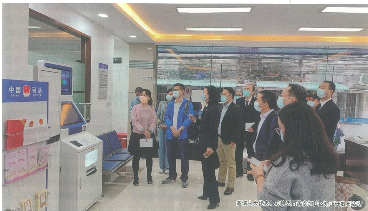
邀请人大代表、政协委员等参加社区矫正开放日活动