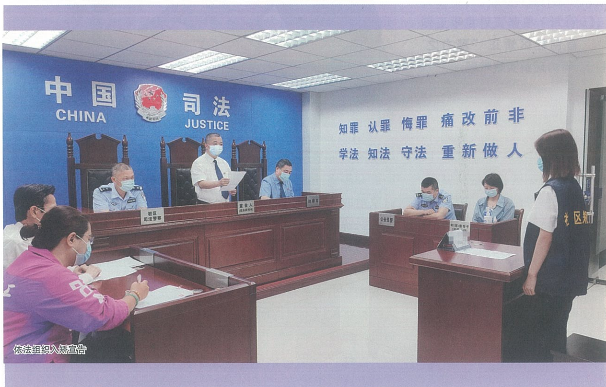
依法组织入矫宣告

社会力量整合等问题。二是集中优势资源在区社区矫正中心设立心理矫治室、心理健康教育室和园艺矫治区，常驻心理咨询师1名，专业社工4名，常年开展“大器学堂”心理健康主题教育、团体沙盘游戏等心理矫治活动。三是于2019年3月打造了全国首个社区矫正园艺矫治项目——越秀阳光“花叙新生”园艺舍，并于2022年5月完成“园艺矫治项目3.0版”升级改造。通过开展芬芳访谈、植物栽培、干花制作与园艺操作等服务，对心理状态失衡、社会融入困难的社区矫正对象进行心理矫治。截至目前，针对社区矫正对象开展心理测评905人次，心理