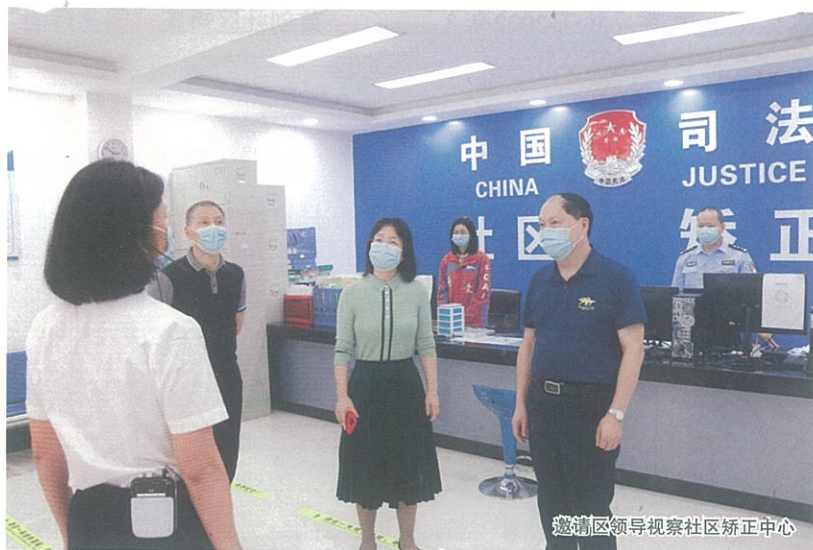
邀请区领导视察社区矫正中心

在横向上，设立越秀区社区矫正委员会，由区委副书记、区委政法委书记担任主任，区政府副区长、区公安局局长担任常务副主任，进一步加强社区矫正工作的组织领导和统筹协调。在区社区矫正委员会的统筹协调下，越秀区人民法院提高了法律文书交付执行效率，重新调整完善了《社区矫正告知书》，加强了执行地确定相关证明材料审核把关，推动《社区矫正法》相关