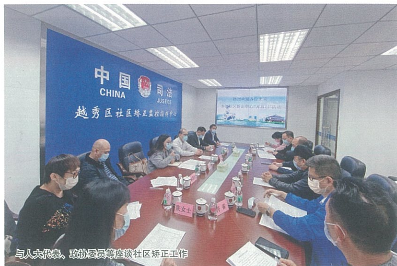
与人代表、政协委员等座谈社区矫正工作

区矫正对象出入境、外出、违法、犯罪等情况。六是每年一病情鉴定。建立越秀区暂予监外执行情况通报机制，按季度将暂予监外执行社区矫正对象的妊娠检查、病情复查或婴儿保健情况通报人民检察院和批准、决定机关以及有关监狱、看守所。委托中山大学法医鉴定中心每年至少一次对暂予监