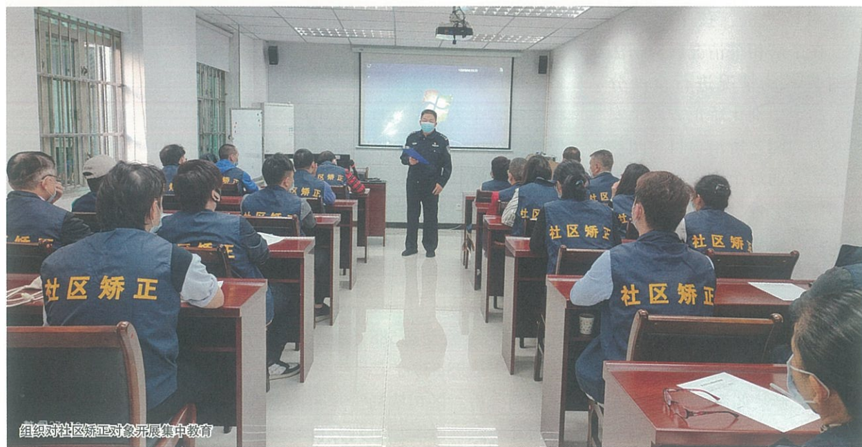
组织对社区矫正对象开展集中教育